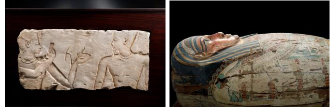
王とアトム神のリーフ/第3中間期・第22王朝 人型木棺/ブトレマイオス朝時代初期