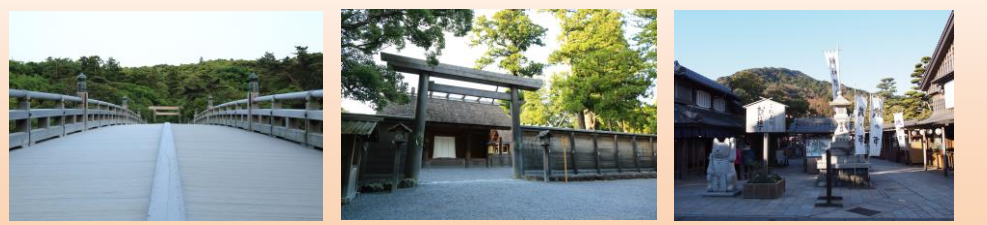
※左から内宮宇治橋、外宮正宮、おかげ横丁

伊勢神宮外宮(豊受大神宮) 高倉山を背に鎮座し、内宮の天照大御神のお食事を司る御饌都神で、衣食住、産業の守り神としても崇敬されています。