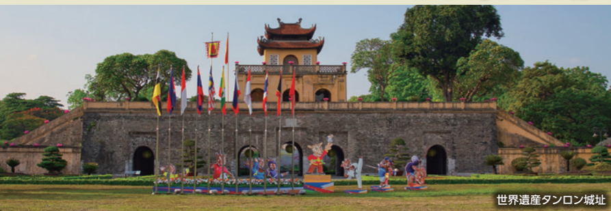
世界遺産タンロン城址