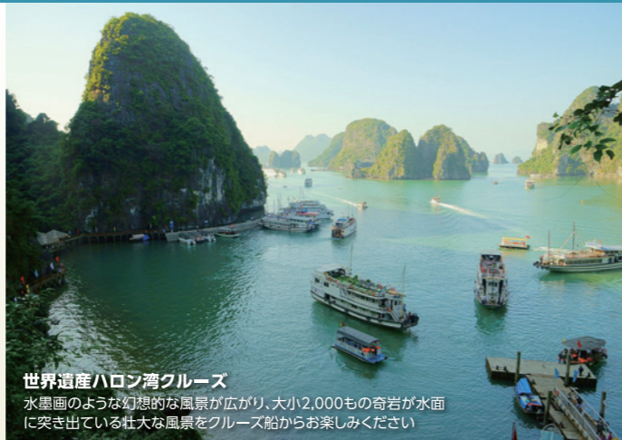
世界遺産ハロン湾クルーズ 水墨画のような幻想的な風景が広がり、大小2,000もの奇岩が水面に突き出ている壮大な風景をクルーズ船からお楽しみください

D ホーチミン連泊! プーチン・パリ ホーチミン満喫 デラックスクラス ホテル利用 269,800円